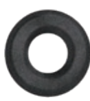
3.201.00 Rozeta klejona w optyce stali czarnej